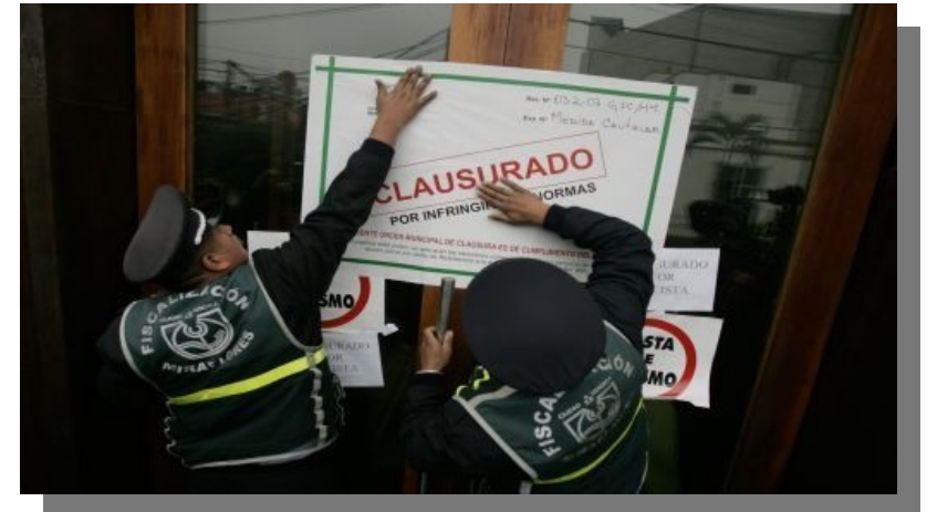
Clausura de Café del Mar